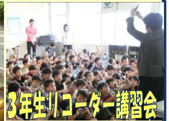
3年生リコーダー講習会